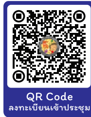
QR Code ลงทะเบียนเข้าประชุม