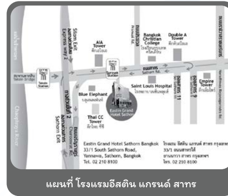
แผนที่ โรงแรมอีสติน แกรนด์ สาทร