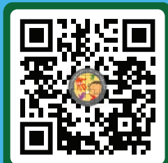
QR Code รายละเอียดการประชุม