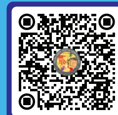
QR Code ลงทะเบียนเข้าประชุม